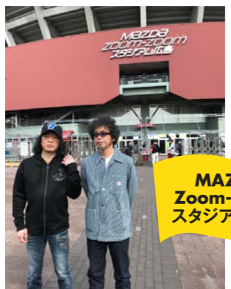
MAZDA Zoom-Zoom スタジアム広島

といった感じで説明。また「このキャンペーンで初めて聞いた」(奥田)という2019年に《100個の楽しいことをやる宣言》も。手島